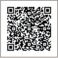
QR코드 찍고 신청서 접수